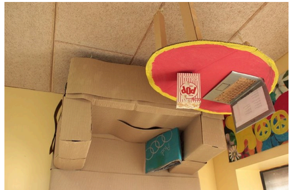
Fra et kunsternet – upside down

Vi vil således kunne stille flere muligheder til rådighed, hvor de studerende vil kunne hente inspiration til arbejdet med deres tre kompetencemål, som er centrale i praktikken.